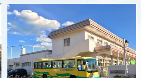
横浜市南部地域療育センター エリア：磯子区・金沢区