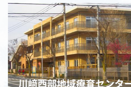
川崎西部地域療育センター エリア：宮前区・多摩区（一部）

青い鳥では、横浜市内3か所と川崎市と横須賀市で各1か所の地域療育センターを運営しています。