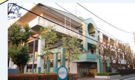
横浜中部地域療育センター エリア：南区・中区・西区