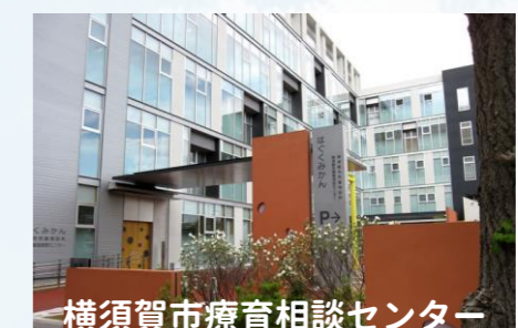
横須賀市療育相談センター エリア：横須賀市全域