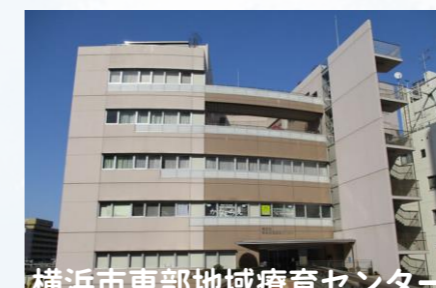
横浜市東部地域療育センター エリア：神奈川区・鶴見区